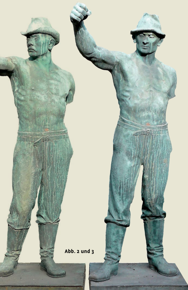
Abb. 2 und 3

Als 1910 in der Bochumer Pieperstraße das neue Verwaltungsgebäude des Allgemeinen Knappschafts-Vereins seine Pforten öffnete, empfingen die Besucher auf der Empore der Eingangstreppe zwei beeindruckende Bronzeskulpturen (Abb. 2 und 3). Sie zeigten kraftvolle Bergarbeiter, mit und ohne Schnurrbart, bekleidet nur mit Hut und einfachen Hosen. Beide hielten in der Rechten eine Grubenlampe,